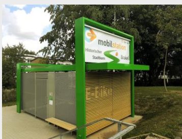
Verschließbare Fahrradabstellanlage in Brakel, Kreis Höxter

Über ein Buchungsportal, welches v.a. auch in vorhandene Apps und Webseiten der Verkehrsräume integriert werden soll, können sich Nutzer künftig für jeden Standort NRW-weit über das Fahrradstellplatzangebot informieren und verlässlich einen Platz buchen und bezahlen. Die Kompatibilität mit bereits in NRW existierenden Portalen wie „DeinRadschloss“, „BikeParkBox“, „B+R-Offensive“ oder „BikeAndRideBox“ ist vorgesehen.